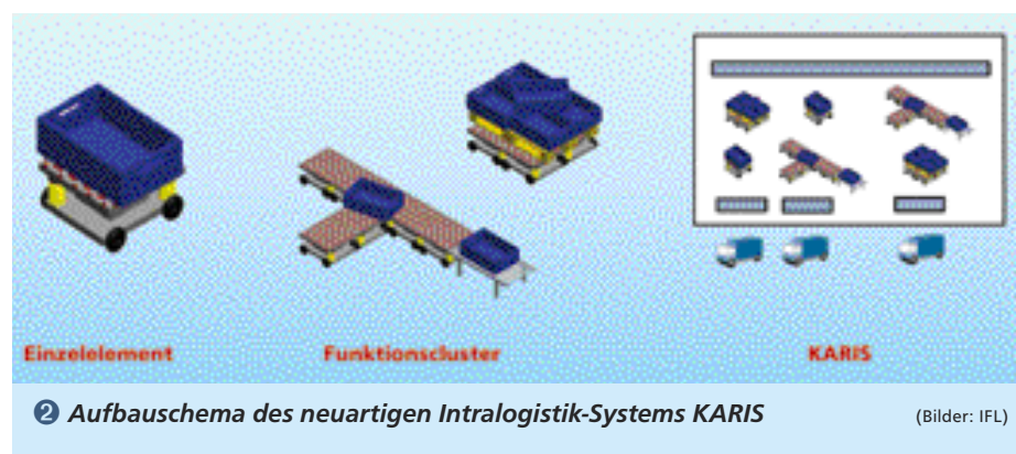
2 Aufbauschema des neuartigen Intralogistik-Systems KARIS

Der Fortschritt in den Basistechnologien verdeutlicht, dass der erstgenannte Grund nur eingeschränkt Einfluss haben kann. Vor allem Neuerungen in den Bereichen Energieübertragung und -speicherung, drahtlose Kommunikation, Sensorik und optische Szenenerfassung mit Bilderkennung, Speichermedien, Identifikationssysteme mit RFID, buskompatible Aktorik/Antriebstechnik, Mikrosystemtechnik, Fertigungsverfahren und Informatik mit dezentralen Agentensystemen und selbststeuernden Systemen haben in jüngster Vergangenheit neue technische Möglichkeiten geschaffen. Das Resultat sind einerseits Systeme, welche die bekannte Performance zu deutlich reduzierten Kosten bereitstellen oder aber eine deutliche Performancesteigerung zu autonomen Systemen bei gleichen Kosten ermöglichen.